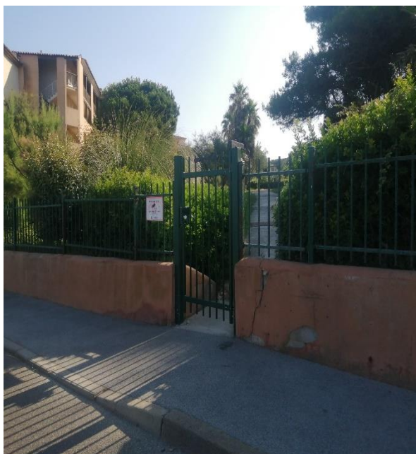
La corniche, ouverture accédant aux pinèdes d'Aryana