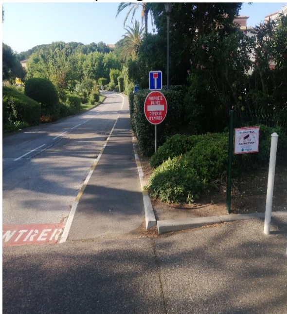
Sur le carrefour du chemin communal