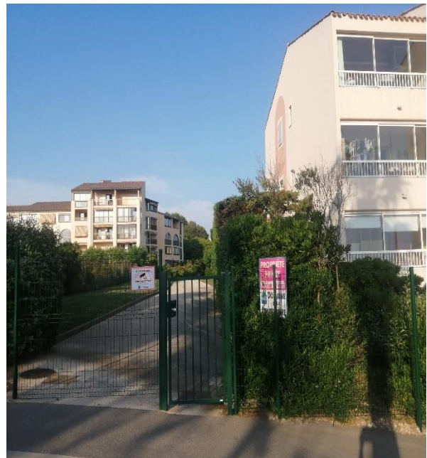
Allée des pompiers