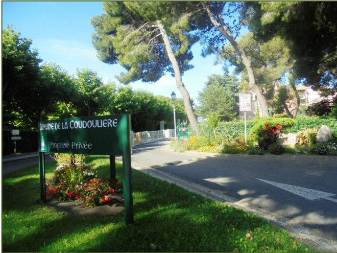
Les barrières à l'entrée du domaine