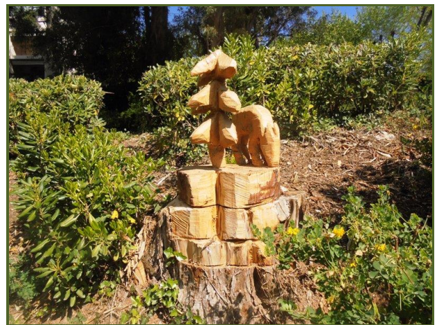
La biche sous le sapin