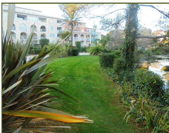
Face au hameau du lac