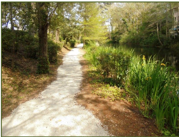
Berge intérieure du lac rond