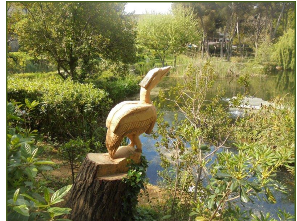
Près du pont