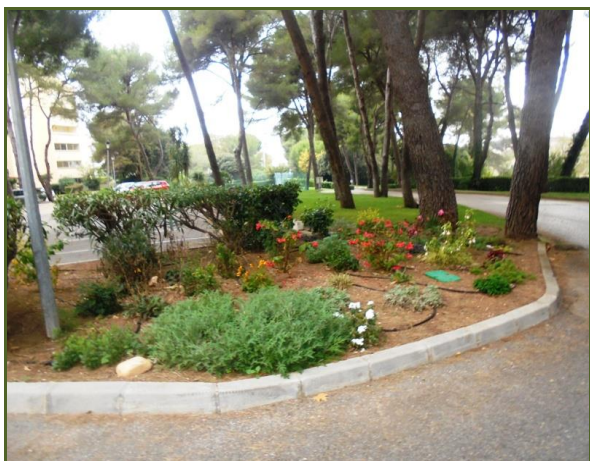
Vers les Pinèdes d'Aryana