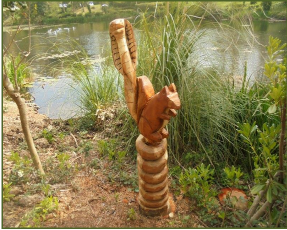
Le cobra et l'écureuil