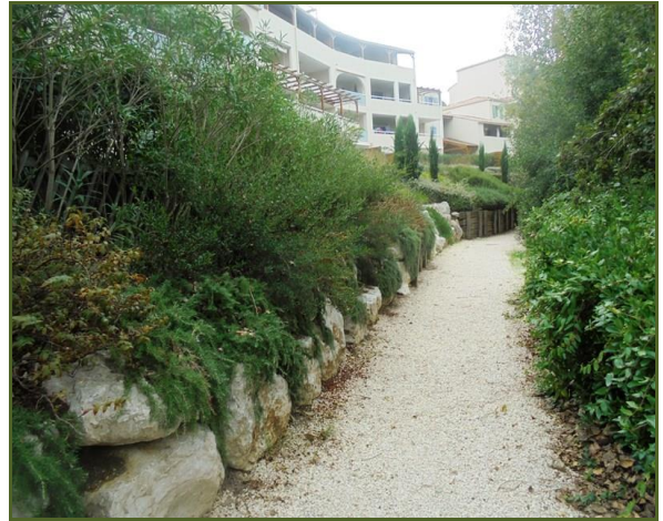
Résidence du lac